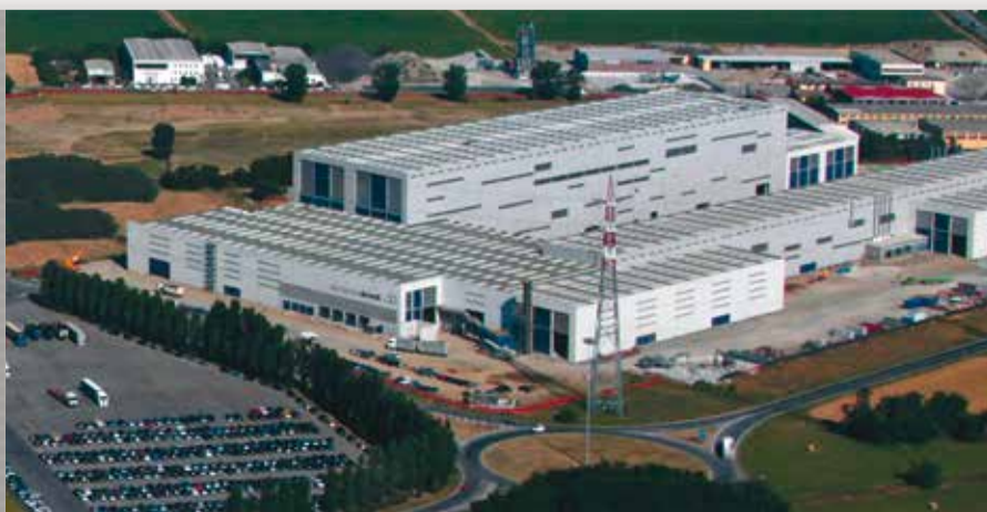
Una vista aerea della parte dell'Acciaieria Arvedi destinata alle linee di decappaggio, zincatura e preverniciatura dei coils

Film finitura: Poliestere Back coat: PUR/PIR schiumabile Antifluting: disponibile Colori personalizzabili Disponibile singola e doppia faccia